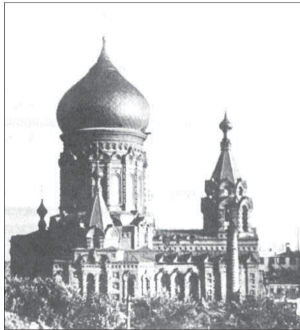
Свято-Софийский собор в Харбине