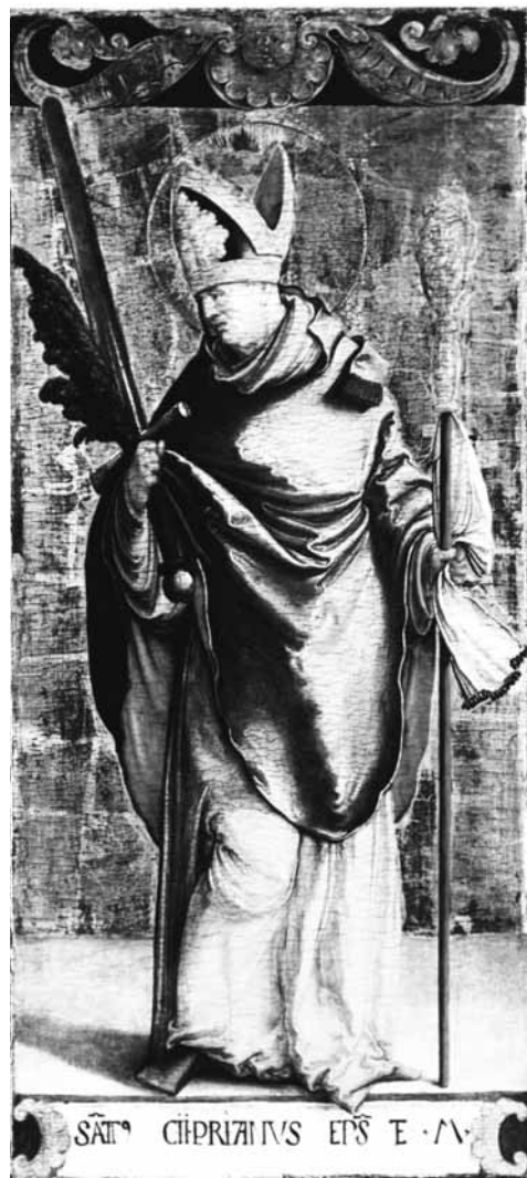
Св. Киприан Карфагенский (лат. Thascius Caecilius Cyprianus ; ум. 14 сентября 258 г.) — искусный латинский богослов, сочинения которого посвящены осмыслению вопросов отступничества и раскола.

В Римской империи всегда официально объявлялось начало гонений, как это было при императоре Валериане. В 257 году последовал указ, запрещающий христианам собираться на богослужение и посещать места погребений, в противном случае их ожидала казнь. В 258 году последовал другой указ, предписывающий казнить всех клириков, если они не отрекутся от Господа Иисуса Христа, и ссылать в ссылку всех не отрекшихся христиан, если те принадлежали к высшим сословиям. На допросе при первом аресте, в соответствии с императорским указом, все, кто не держится римской религии, должны были возвратиться к ней и принести жертвы. «Что ты на это скажешь?» — спросил проконсул епископа Карфагенского Киприана, объявив ему первый императорский указ. «Я христиа-