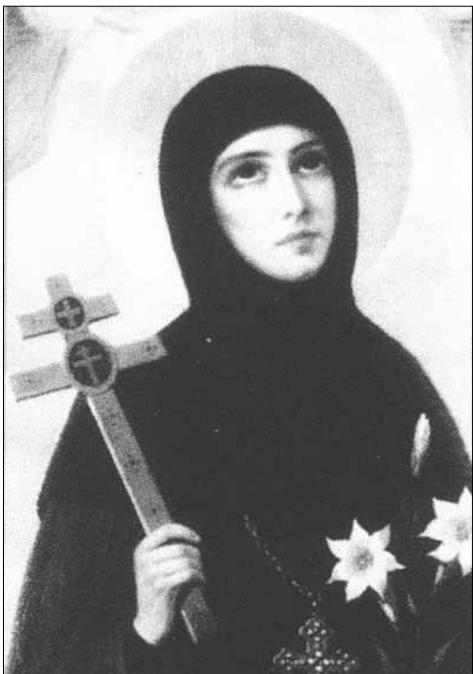
5 июня, суббота — ПРЕПОДОБНОЙ ЕФРОСИНИИ ПОЛОЦКОЙ