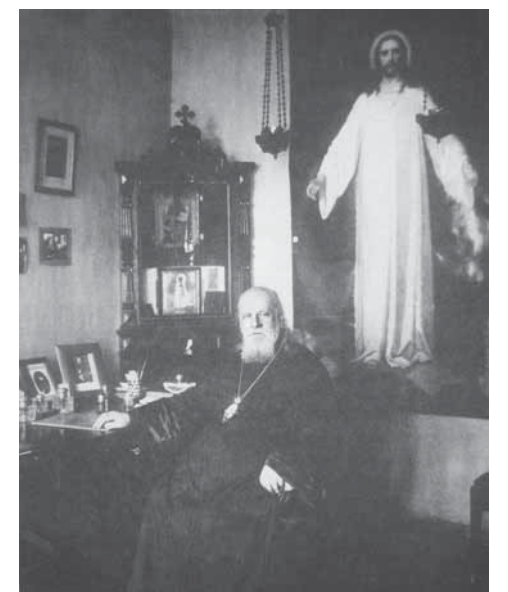
«Часто пишется — казнь, а читается правильно — песнь» Сщмч. Серафим

Из стихотворения «Душа изнемогла» священномученика Серафима (Чичагова)