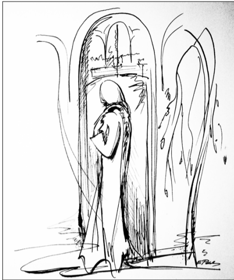
Графика Елены Романовой