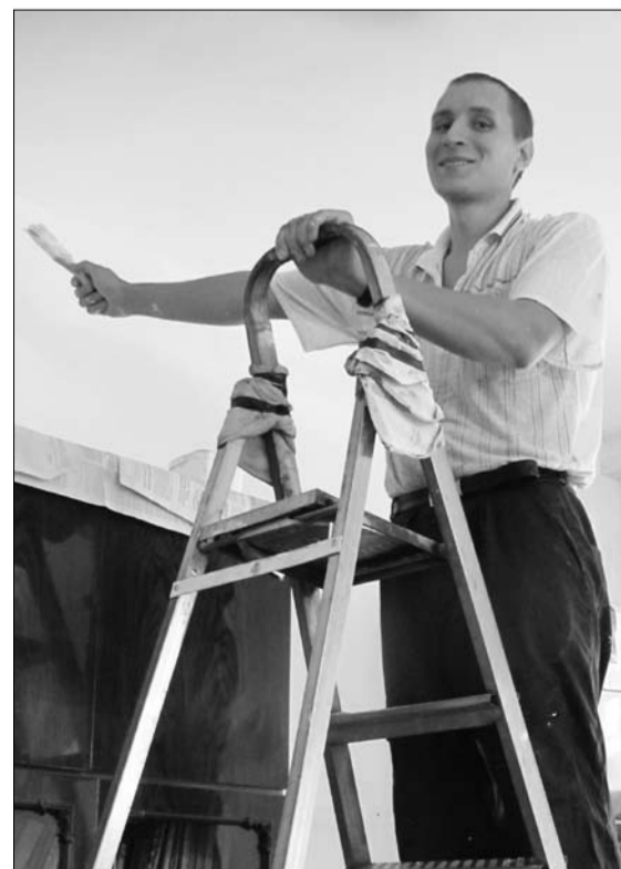
Ремонт в воскресной школе.