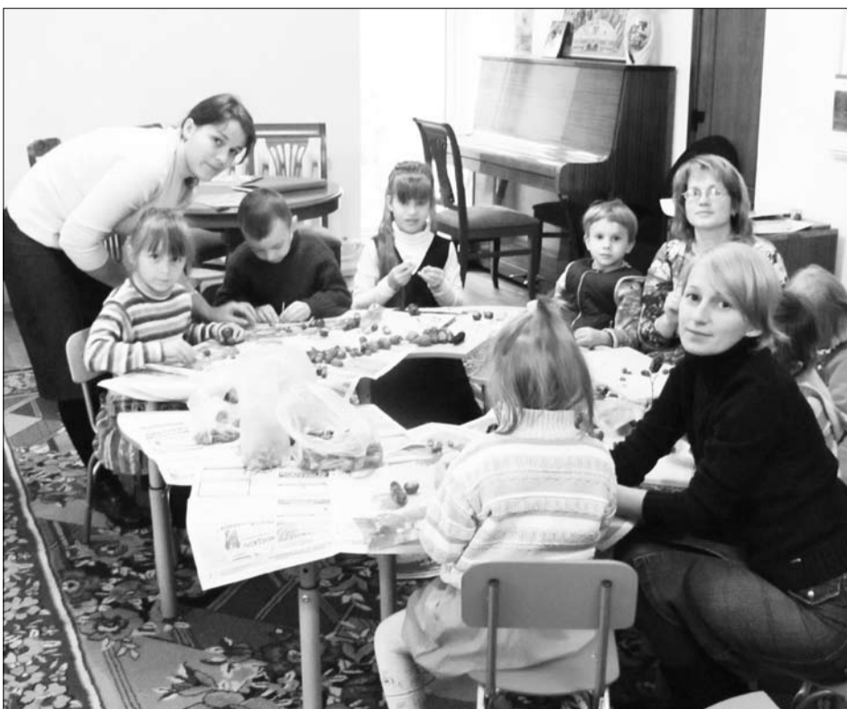
«Добрые ручки». На занятии кружка (рисование, лепка, конструирование, аппликация).