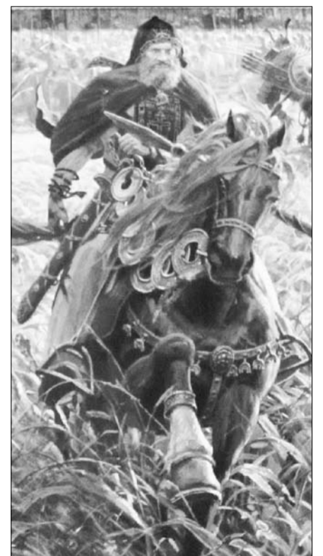
П. Рыженко «Пересвет». Фрагмент картины.