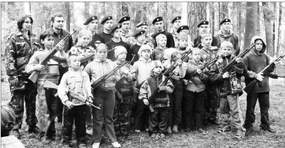
Участники военно-спортивной игры: Центр вневоинсковой подготовки «Каскад» и детская воскресная школа «Звонница» Космо-Дамианского (Покровского) храма.

Ты Сам сказал: стучите — отворят; Исправь меня! - я в Небеса взываю. Ты - мой Господь, и в каждом слове свят, Прости меня, отверзи двери Рая.