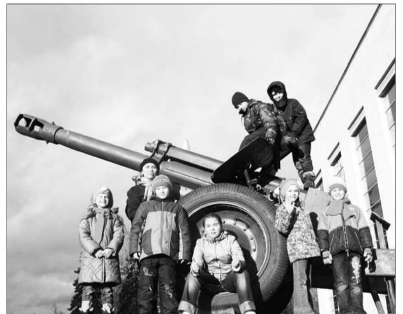
На территории Музея Вооруженных сил.