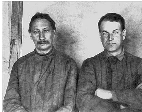
В Соловецком лагере (слева П. Флоренский)

В воспоминаниях сокамерников отец Павел запечатлен как человек необычайно доброжелательный к окружающим, готовый поделиться с нуждавшимся и пайкой хлеба, и своими знаниями, а с теми, у кого открыто сердце, — словом Божиим.