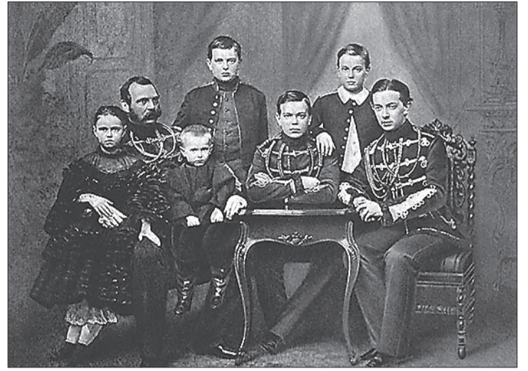
Император Александр с семьей

Террористы из партии «Народная воля» много лет вели за ним охоту — рыли подкоп для взрыва мостовой, закладывали взрывчатку на рельсы перед поездом и т. д. Покушаясь на жизнь царя, народовольцы даже ухитрились устроить взрыв в Зимнем дворце, где жил российский самодержец.